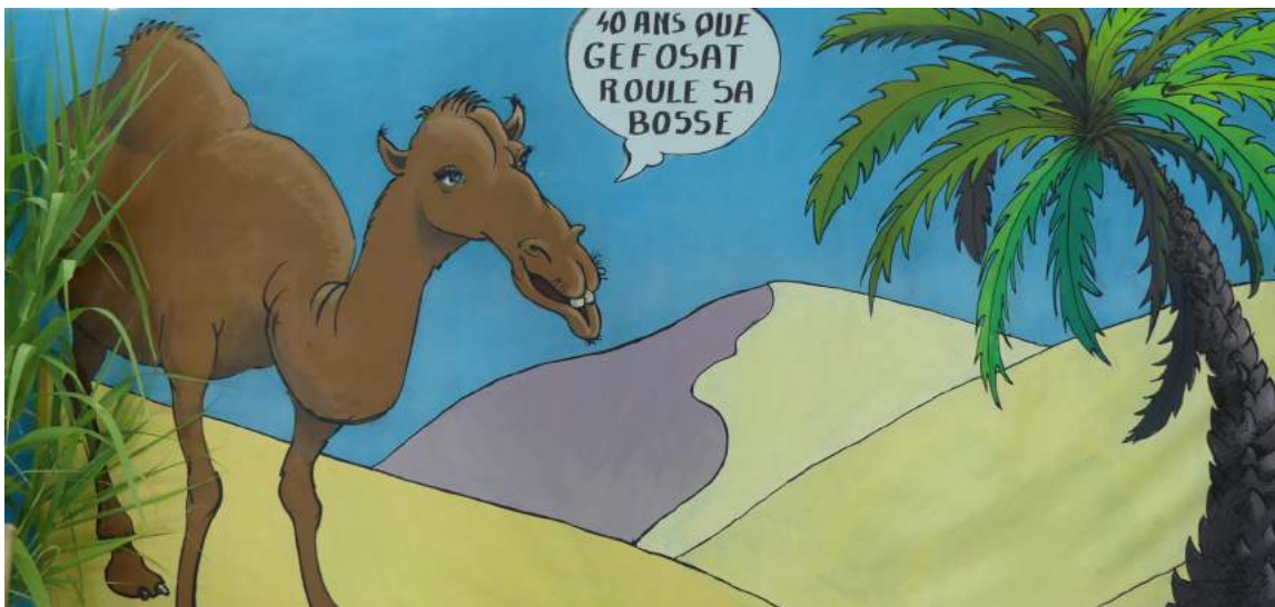
« Le Dromomaton »