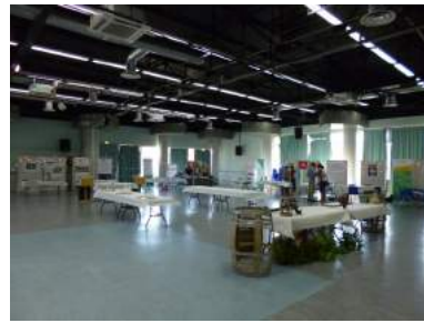
Tout est prêt !