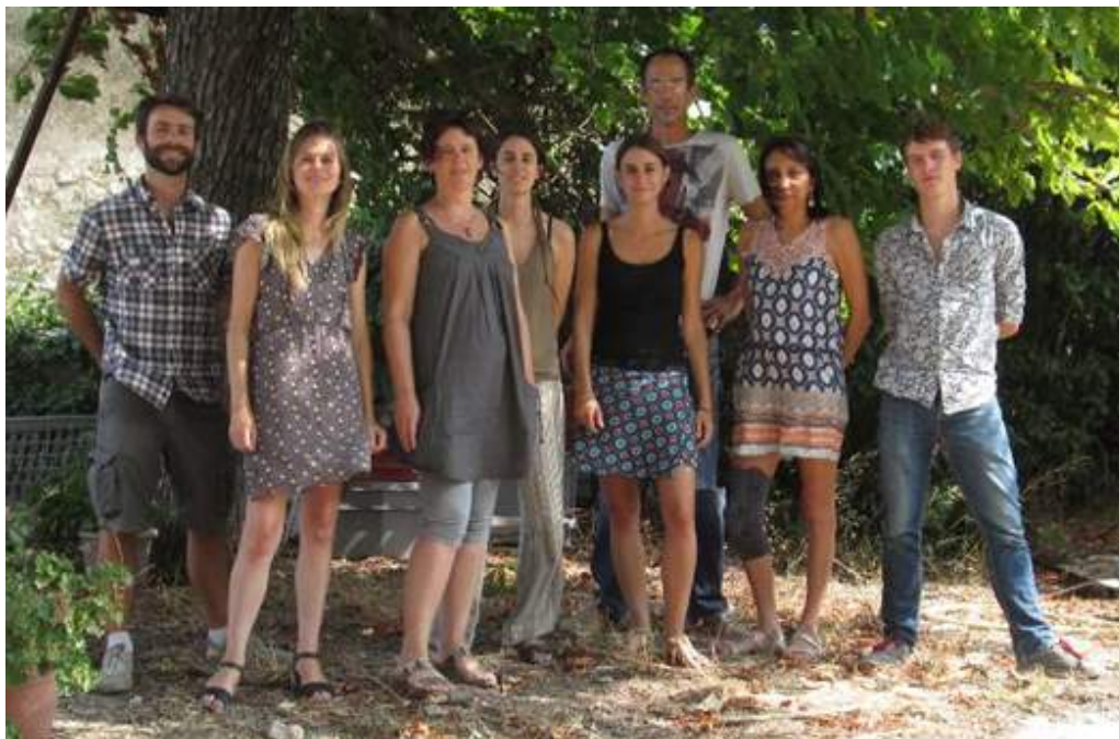
Séminaire de rentrée 2018 – Château de Stony à Frontignan