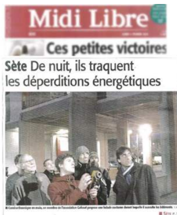
Première page du midi libre : balade thermo sur Sète