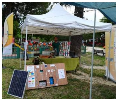
Participation à la fête de quartier Clemenceau avec un stand énergies renouvelables

Voici quelques autres exemples d'actions :