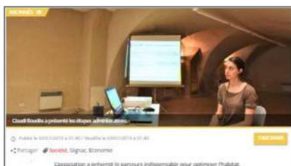
Article sur midi libre.fr: Intervention sur les aides financières avec Demain La Terre