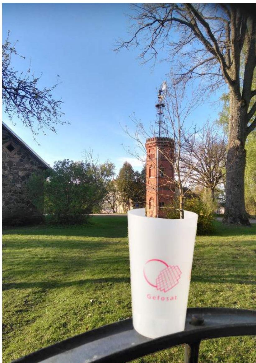
Lettonie 2019