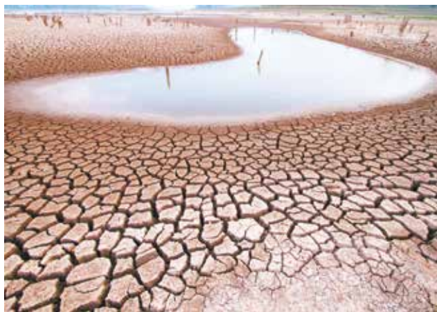
Des sécheresses encore plus longues sont à craindre en Afrique avec de lourdes conséquences pour les populations, la faune et la flore.

La majorité des modèles climatiques conclut que la pluviométrie va augmenter aux hautes latitudes tempérées et diminuer dans les zones tropicales de l'hémisphère Nord. Le dérèglement des saisons et le déplacement des masses d'air pourraient, à long terme, accroître le nombre d'événements climatiques extrêmes.