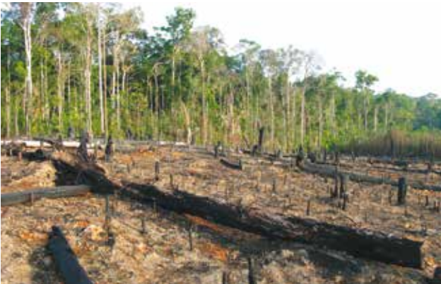
En Amazonie, pour créer de nouvelles surfaces agricoles, de vastes étendues de forêts sont coupées et brûlées.

La déforestation est source d'émission de gaz à effet de serre car les sols relâchent une partie du carbone organique stocké. En supprimant des végétaux qui auraient absorbé le CO 2 , elle participe également à l'augmentation de la concentration de ces gaz dans l'atmosphère.