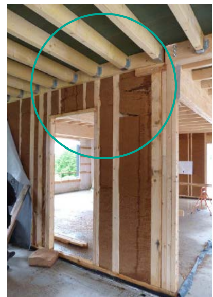
18. 19. 20. Tassement de la fibre de bois suite à une arrivée d'eau en toiture en cours de chantier