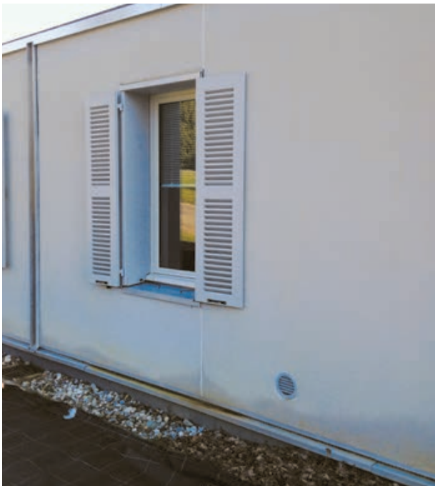
6. Enduits exposés au nord présentant de l'humidité une bonne partie de l'année