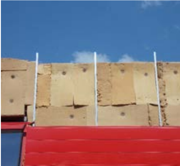
21. Mise en œuvre fantaisiste d'un isolant en fibre de bois : risque de ponts thermiques