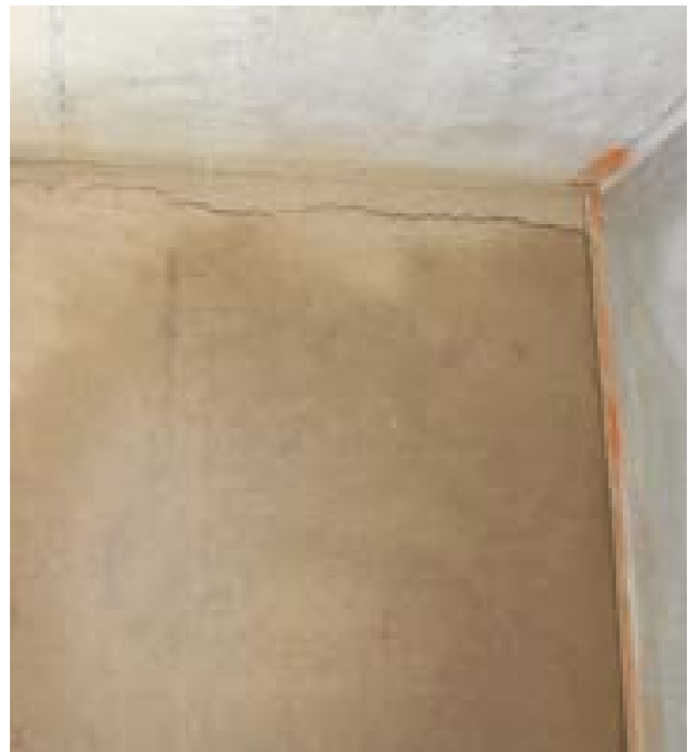
7. Enduits terre sur isolant paille : conditions et temps de séchage inappropriés