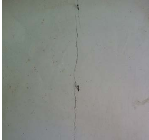
14. Fissuration au droit d'un poteau de structure suite à un défaut d'enrobage