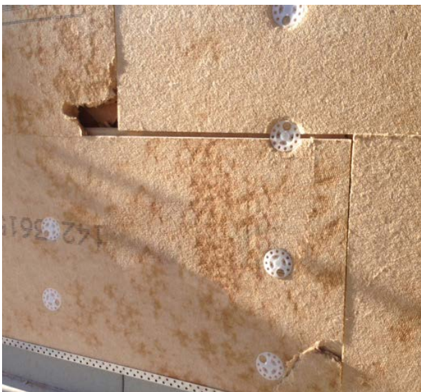
23. 24. Mauvaise mise en œuvre : plaques abîmées - plaques non jointives - fixations dans les joints - nombre de fixations non conformes -...