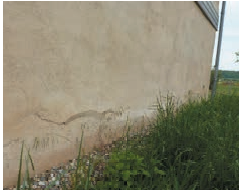
1. Remontées capillaires (non-respect des Règles professionnelles)

La paille étant un matériau putrescible, l'attaque des moisissures peut être très rapide. Les symptômes apparaissant immédiatement, les désordres et sinistres liés à des défauts de conception et/ou de mise en œuvre sont la plupart du temps détectés avant la fin du chantier ce qui permet de les corriger facilement. Le remplacement de la paille atteinte peut ainsi être réalisé, soit par de nouvelles bottes de paille saine, quelle que soit la technique (bottes nues ou bottes en caisson), soit par un autre matériau (ouate de cellulose ou fibre de bois) dans le cas de caissons.