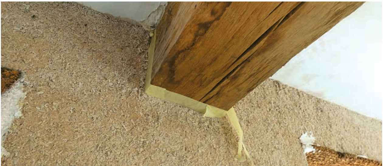
17. Noircissement d'une poutre apparente suite au contact avec la chaux.