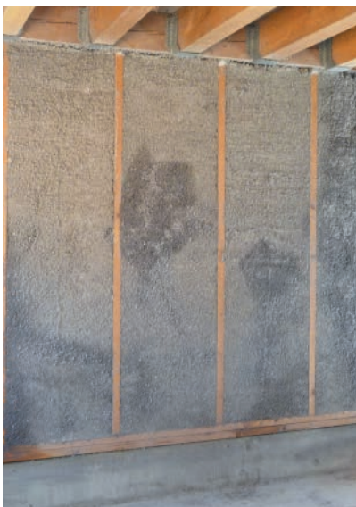
25. Développement de moisissures sur une façade orientée au nord