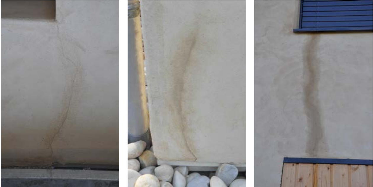
3.4.5. Fissuration d'un enduit chaux sur une isolation en paille