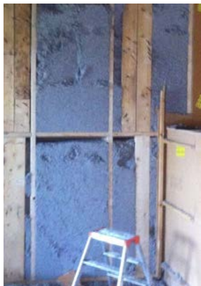
26. 27. Tassement de la ouate de cellulose dans les caissons verticaux, mauvaise mise en œuvre