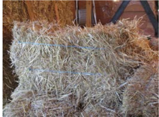
8. Botte de paille éventrée suite à une mauvaise manipulation pouvant entraîner le risque incendie.

Les risques d'incendie en cas d'utilisation de bottes de paille nue sont plus importants au moment de la mise en œuvre que lors de la vie du bâtiment. La technique des bottes nues étant principalement utilisée par les professionnels pour des maisons individuelles ou de petits équipements et dans le cadre d'opérations en autoconstruction, il convient de bien préparer le site du chantier et de définir des zones de stockage et de travail suffisamment éloignées de la construction en cours.