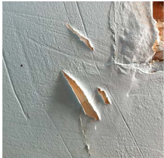
11. 12. Développement de moisissures et décollement du revêtement suite à mise en œuvre de matériaux inadaptés étanches à la vapeur d'eau, type peinture à base de liants synthétiques, sur un mur exposé