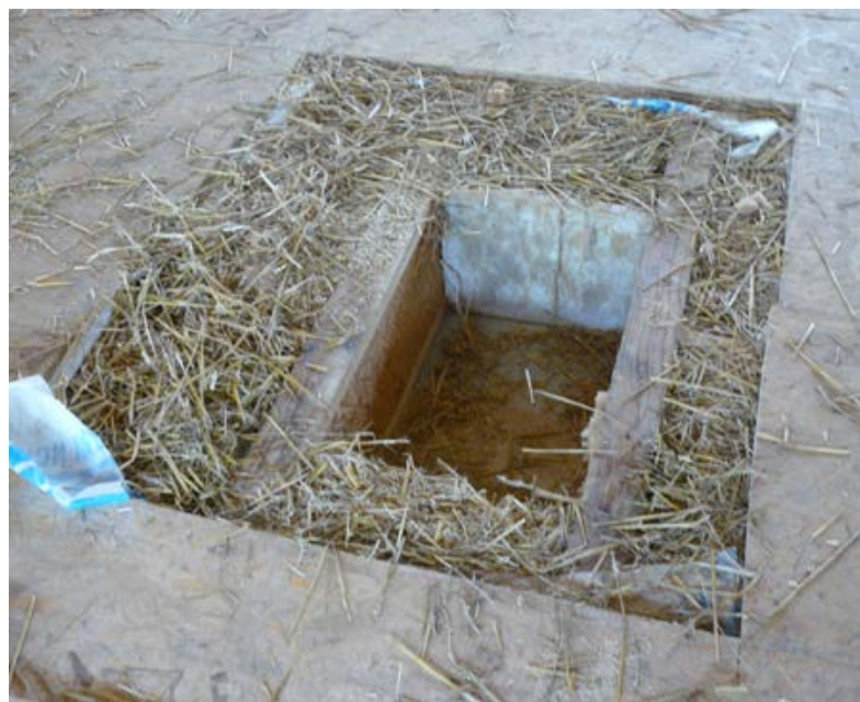
2. Traces d'humidité sur la paroi et dans le fond du caisson