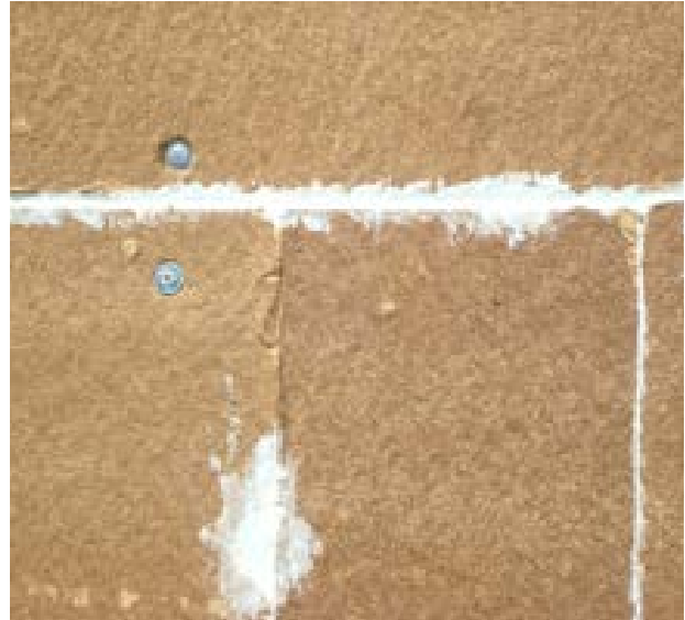
22. Joints silicone entre panneaux de fibre de bois : risque de ponts thermiques