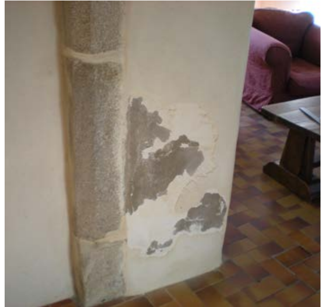
9. 10 Développement de moisissures suite à mise en œuvre de matériaux inadaptés étanches à la vapeur d'eau : enduit extérieur et peinture intérieure