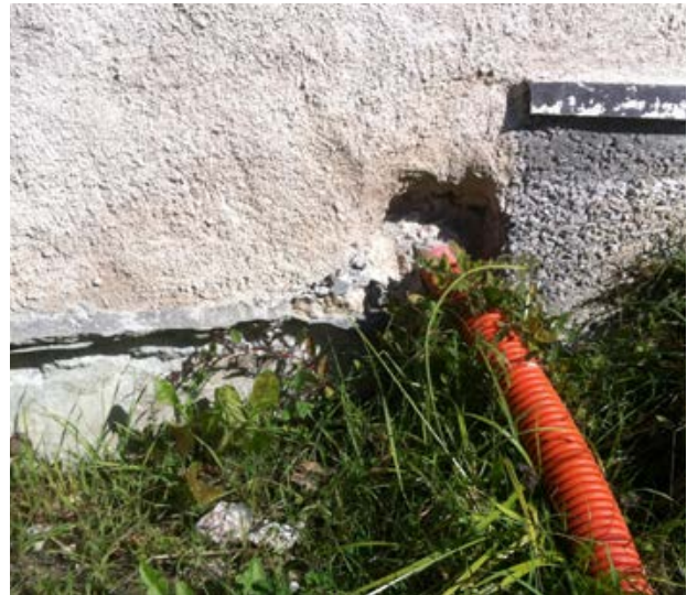
16. Pied de mur non conforme aux RP