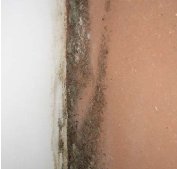
13. Moisissures sur enduit chanvre/chaux suite à infiltration pluie dans mur existant