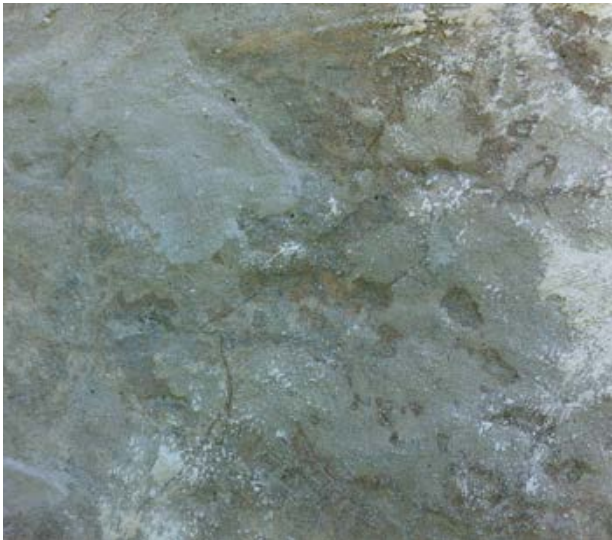
15. Micro fissuration des enduits